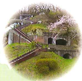
三居沢発電所 日本初の水力発電所