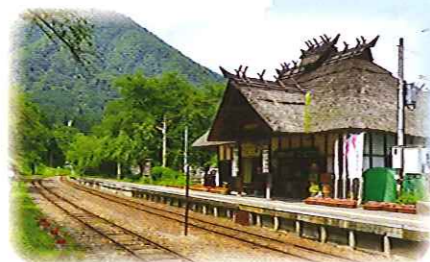
湯野上温泉駅 日本で唯一の茅葺きの駅