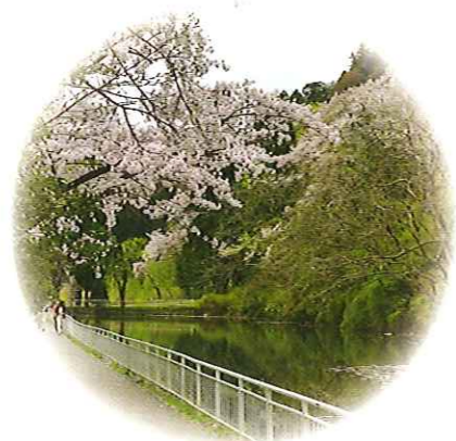
青葉城 五色沼 フィギュアスケート発祥の地