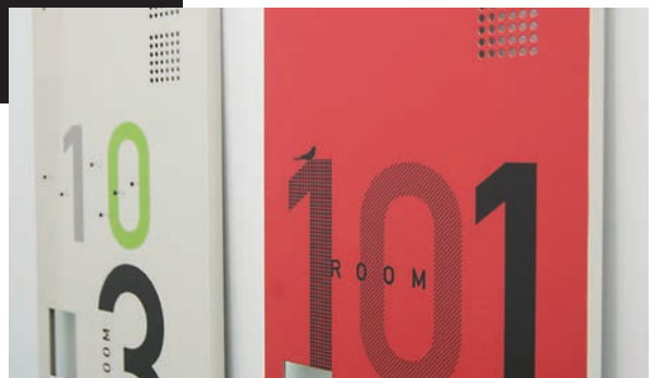
金属製品(ロッカー)へのダイレクトプリント