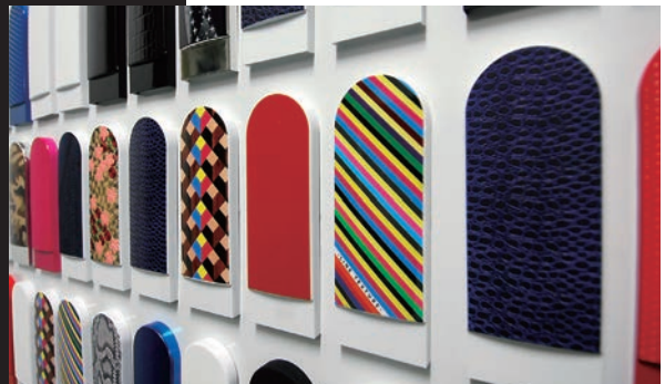
肌触りや凹凸までも印刷で表現するリアルテクスチャー

樹脂成形品や金属製品に今まで以上の価値を付加し、消費者の心をつかむ意匠性を実現するひとつの手法としてインクジェット加飾を提案します。