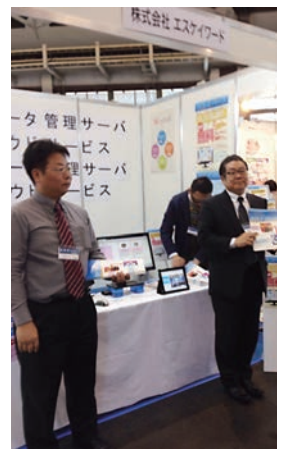
それぞれ個別に出展されていた組合参加企業様の様子。