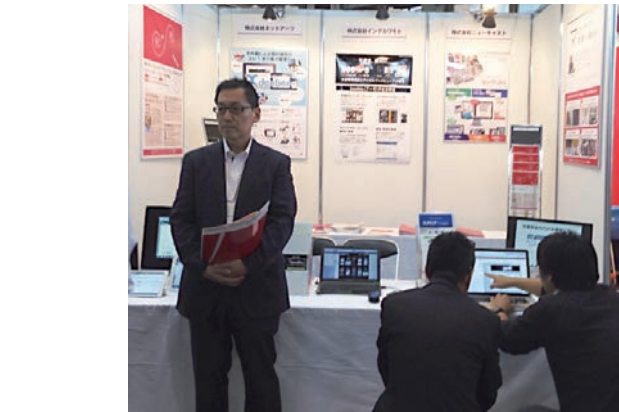
組合ブース出展の様子。 (上)GCC BOOKの冊子とカンファレンスのチラシを配布。 (下)興味を持って頂いた方に、実際にシステムでのデモ ンストレーションを行いながら、紹介。

平成25年11月13日から16日までの4日間、ポートメッセなごやにおいて日本最大級の異業種交流展示会「メッセナゴヤ※」が開催されました。これに伴い、本組合としては初となる組合としてブース参加を行い、組合を広く知って頂けるよう、宣伝を行いました。 ここでは当日の様子・活動内容を簡単に紹介致します。 ◆ ◆ ◆ 組合のブースでは、「中部グラフィックコミュニケーションズ工業組合」「株式会社インクカワモト」「株式会社ネットアーツ」「株式会社ニューキャスト」の1組合・3社合同でブース利用を行い、組合自体の紹介と、それぞれの企業説明・システム紹介等を行いました。