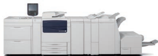
Color C75 Press

●印刷スピード:76ページ/分(A4) ●高いパフォーマンスを発揮する新プリントサーバー ●両面印刷時のずれや面内ムラの簡易自動調整機能 ●美しさを追求した新しい画像処理エンジン